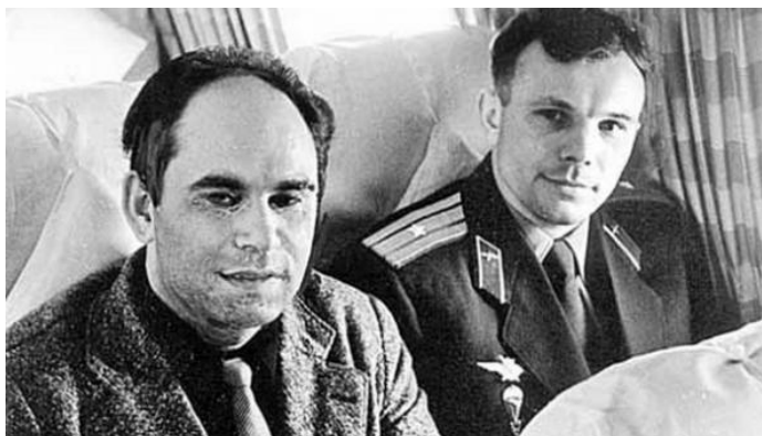
14 апреля 1961 года. Полёт в Москву вместе с Гагариным после окончания его легендарного полёта

Дело в том, что Песков был одним из первых журналистов, допущенных к только зарождавшейся тогда космонавтике и космической теме вообще!